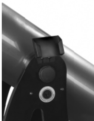
Рисунок 2: Держатель установлен.

После установки держателя просто поместите в него контроллер, предварительно убедившись в том, что провод не попал между контроллером и держателем. Вы можете оставить провод подключенным и нажимать на клавиши контроллера, когда тот находится в держателе. Может оказаться удобным просто оставлять контроллер в держателе все время. Перед разборкой телескопа убедитесь, что контроллер отсоединен от него.